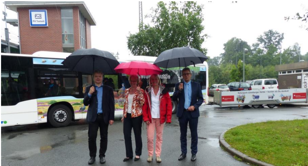
Übersichtskarte Eröffnung der 12. Heide-Shuttle Saison 2017 am 10.7.2017 in Tostedt.