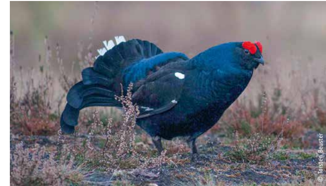
Die seltenen Birkhühner finden im Naturschutzgebiet Lüneburger Heide passende Lebensbedingungen vor.

A ist richtig: 60 % Wald, 26 % Heide, 8 % Grünland, 2 % Moore und 1 % Siedlungen und anders. Zur Blütezeit der Heidebauernwirtschaft um 1850 gab es so gut wie gar keinen Wald in der Region, dafür erheblich mehr Heideflächen.