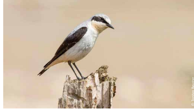
Der Steinschmätzer bevorzugt als Lebensraum offenes, steiniges Gelände.