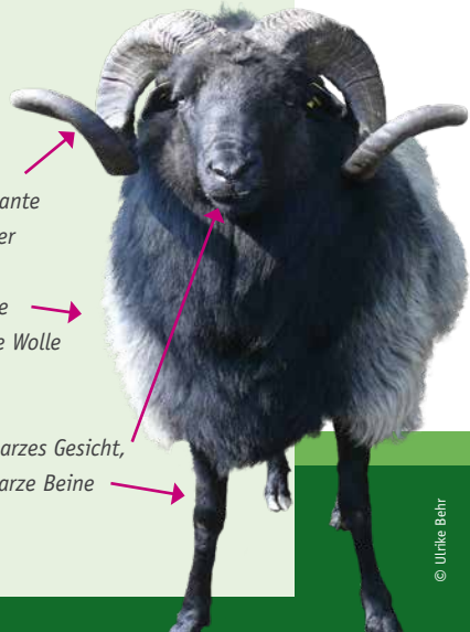
Foto rechts: Die wichtigsten Merkmale der Grauen gehörnten Heidschnucke – hier ein Heidschnuckenbock.