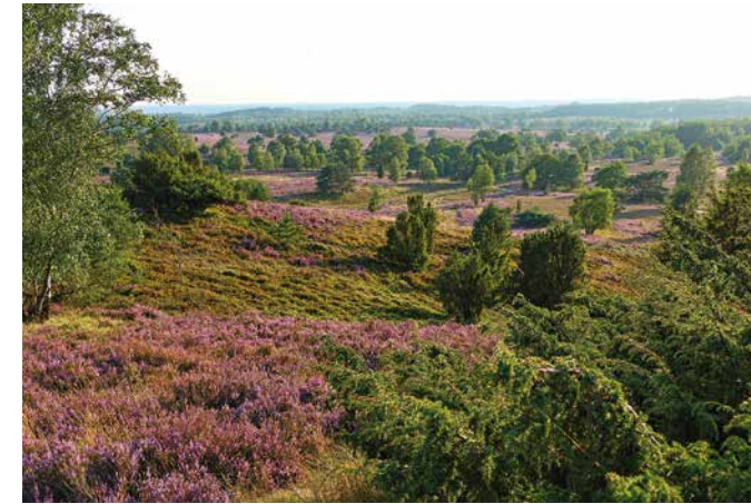
Weitblick und Wacholder – typisch für die Heidelandschaft der Lüneburger Heide.

Die Chance, einem Schäfer oder einer Schäferin mit Heidschnuckenherde zu begegnen, ist hier recht groß. Und zusammen mit blühender Heide und einem schönen Wolkenhimmel entsteht das perfekte Postkartenmotiv.